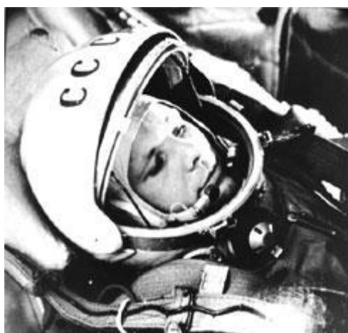
"Кедр" - Гагарин Ю.А.