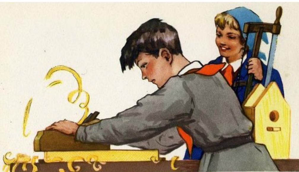
ПИОНЕР ЛЮБИТ ТРУДИТЬСЯ И БЕРЕЖЕТ НАРОДНОЕ ДОБРО