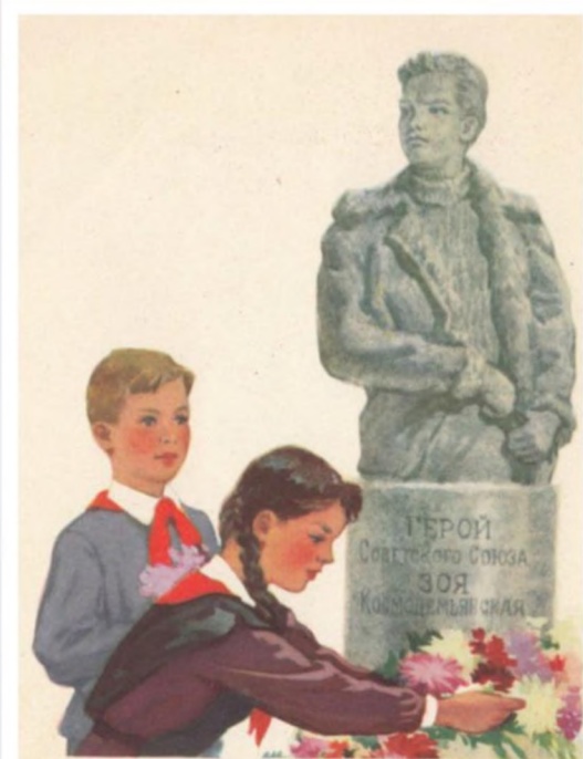
ПИОНЕР ЧТИТ ПАМЯТЬ ТЕХ, КТО ОТДАЛ СВОЮ ЖИЗНЬ В БОРЬБЕ ЗА СВОБОДУ И ПРОЦВЕТАНИЕ СОВЕТСКОЙ РОДИНЫ

Пионер дружен со всеми поколениями, а также чтит память предков.