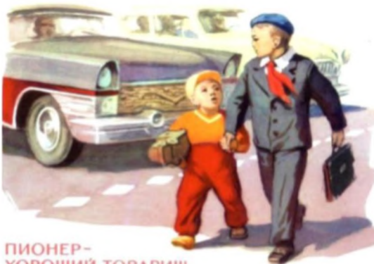
ПИОНЕР - ХОРОШИЙ ТОВАРИЩ, ЗАБОТИТСЯ О МЛАДШИХ.