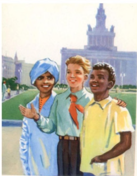
ПИОНЕР ДРУЖИТ С ДЕТЬМИ ВСЕХ СТРАН МИРА