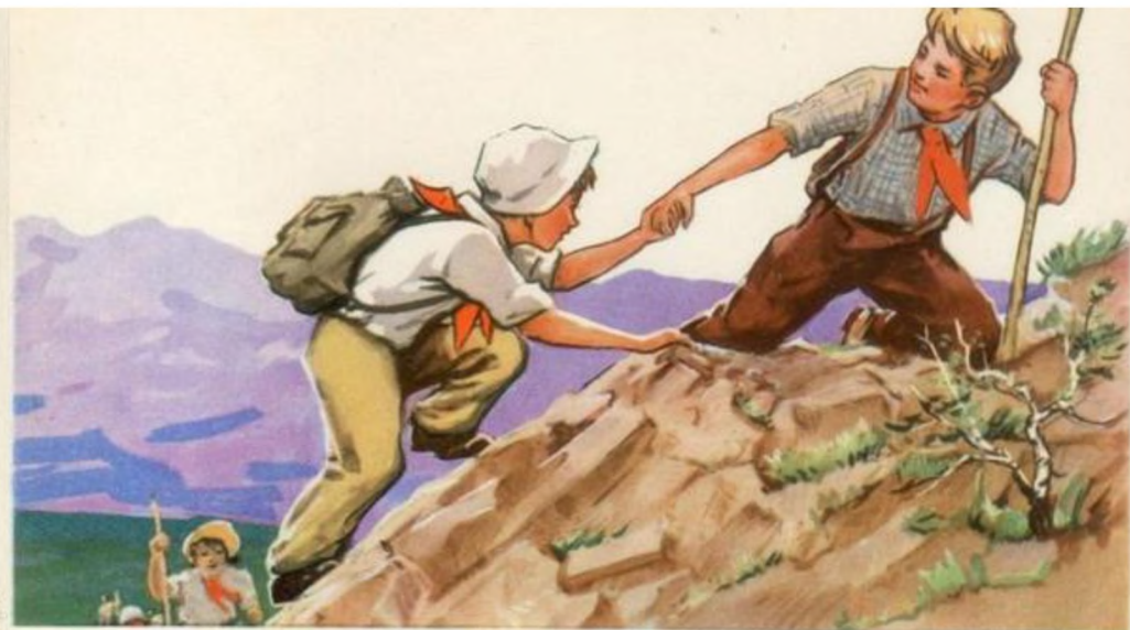
ПИОНЕР РАСТЕТ СМЕЛЫМ И НЕ БОИТСЯ ТРУДНОСТЕЙ

Пионер должен быть трудолюбивым и старательным.